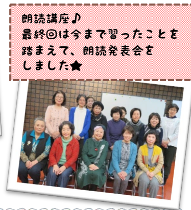
朗読講座♪ 最終回は今まで習ったことを踏まえて、朗読発表会をしました★