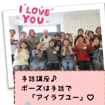
手話講座♪ ポーズは手話で 『アイラブユー』♡

最後に今回の講座で講師を引き受けてくださった登録グループの『手話サークルアキニレ』の皆さん、『朗読グループエコー』の皆さん、ありがとうございました♡!