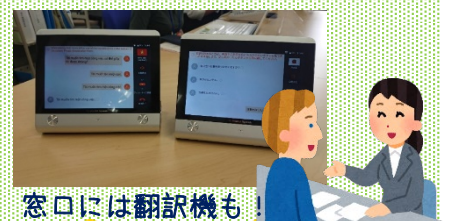
窓口には翻訳機も！