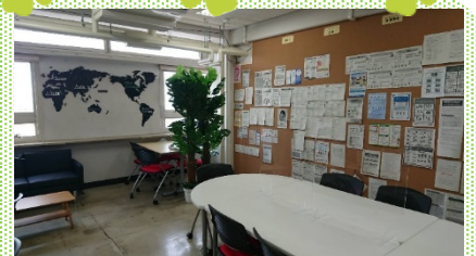
おしゃれなオープンスペース♪

電話：06-6489-6449 メール: ama-welcome@city.amagasaki.hyogo.jp