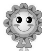
社協キャラクター あまりん