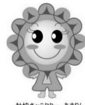
社協キャラクター あまりん