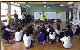
小学校での活動の様子